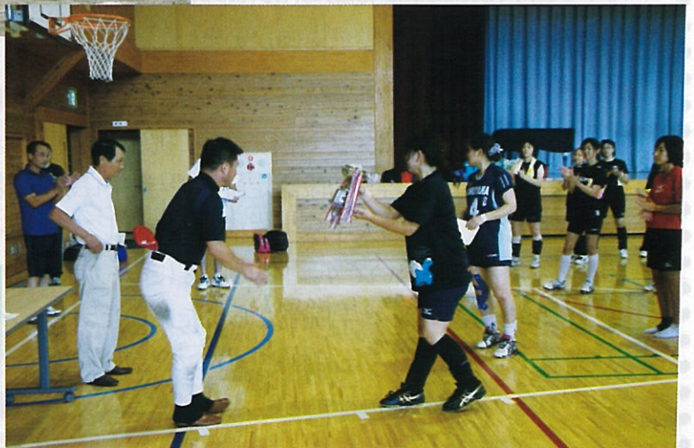
▲ソフトボール大会 表彰式