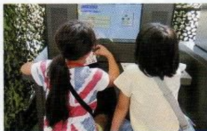
自衛隊クイズに挑戦