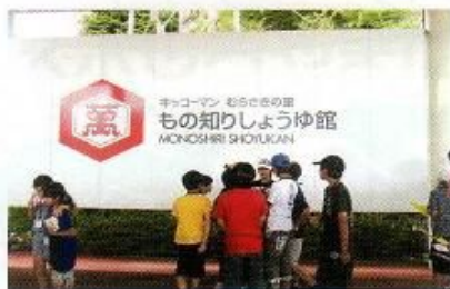
キッコーマン工場