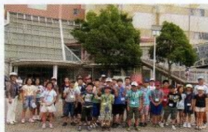
代々木青少年センター前で