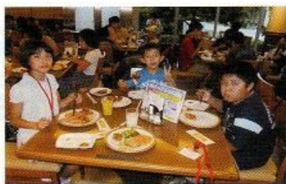
東京ベイワシントンホテルにて夕食