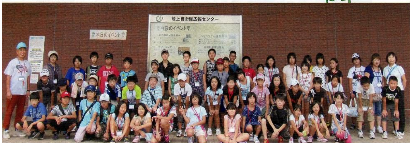
▲りっくんランドで

毎年夏休みに実施している城子連主催の宿泊体験学習を7月26日(金)～27日(土)の2日間で実施しました。地元宇都宮を離れ、東京近郊の工場や施設を訪ねる社会体験学習を目的としています。