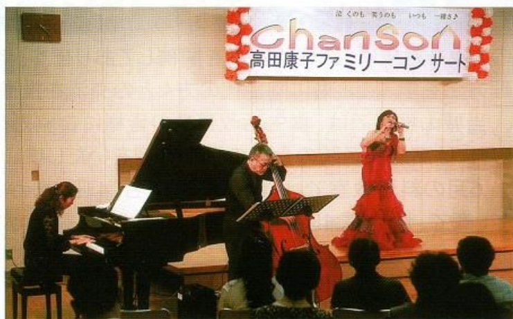
伴奏も見事、歌とぴったり