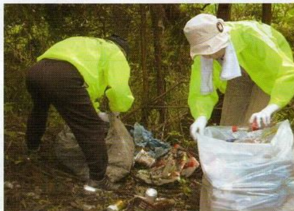
不法投棄されたゴミがたくさん