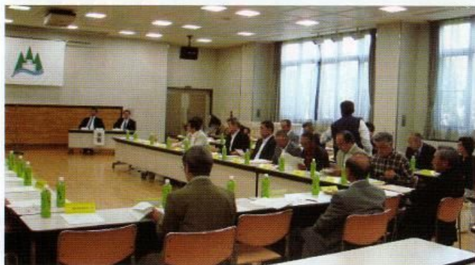
真剣に検討する役員さん

平成23年3月11日に発生した東日本大震災は、国内最大の大地震となり、さらに福島原発の事故により、日本国内はもとより、地球規模の大きな災害となってしまいました。