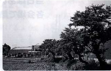
地区市民センターは昔荒針駅のあったところ

この石材鉄道は人々に大変親しまれていたようで、明保通りを機関車が走っていた頃、大谷の子供たちは、線路に釘を置いてペチャンコにし、刀に見