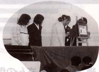
♡城山中学校JRCの会員と お友達によります紙芝居♡