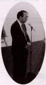
♡センター所長 教育講話♡