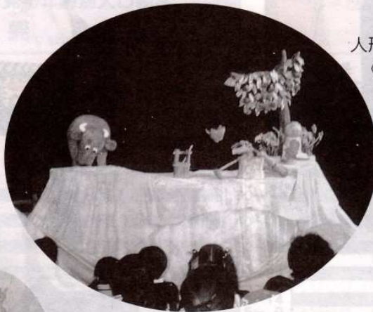
人形劇団 《くぐつ》 によります 人形芝居 「さるかに ばなし」 公演