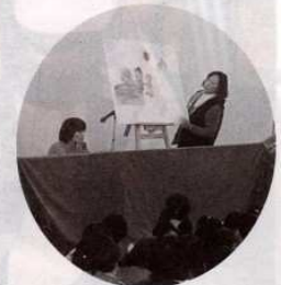
§パネルシアター§ ♡おおきなカブ♡