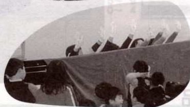
♡手袋を使ったドレミの歌♡