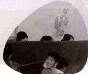
§ペープサート§ ♡オオカミの子キンシチュー♡