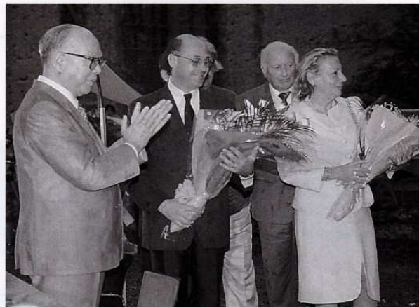
〔増山市長とニコライ市長(写真中央)〕

ピエトラサンタ市は、イタリア共和国の中西部トスカーナ州ルッカ県に位置し、人口約25,000人、ピサとジェノバを結ぶ鉄道の沿線にある美しく静かな地方都市です。