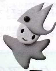
マスコット「ラッピー」